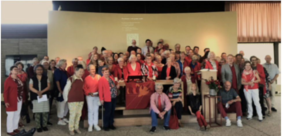
kleurrijk beeld Pinksteren 2024